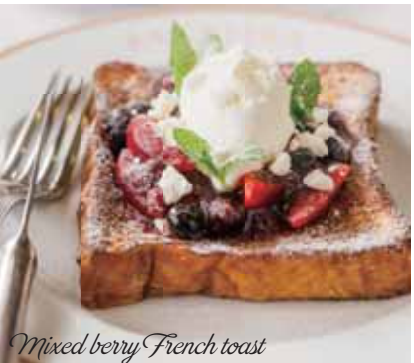
Mixed berry French toast