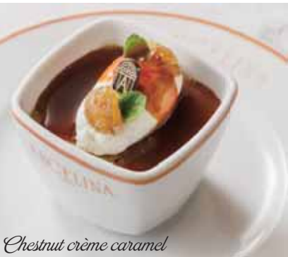
Chestnut crème caramel