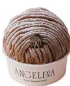
デミサイズ DEMI (Half-size)