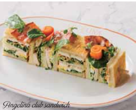
Angelina club sandwich