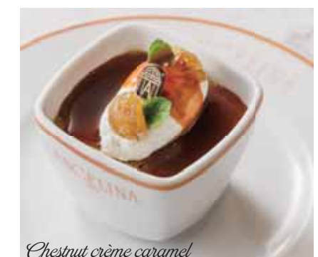
Chestnut crème caramel