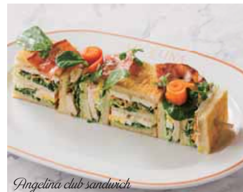
Angelina club sandwich