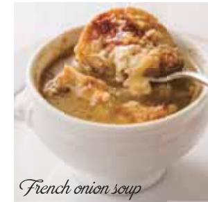
French onion soup