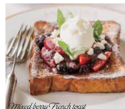
Mixed berry French toast

マロン クレームキャラメル 1,100 マロンクリーム、マスカルポーネチーズ、マロンシロップ漬け、塩バターキャラメルソース Chestnut crème caramel • chestnut cream, Mascarpone, chestnuts in syrup, salted butter caramel sauce