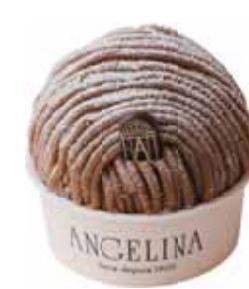
デミサイズ DEMI (Half-size)