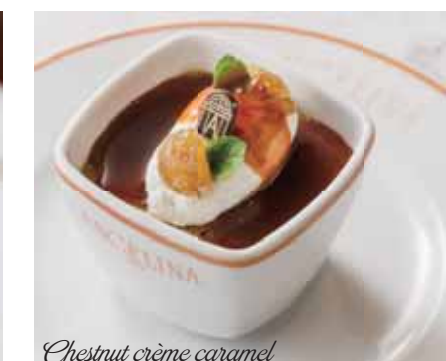
Chestnut crème caramel