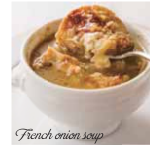
French onion soup