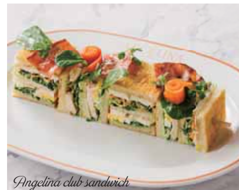
Angelina club sandwich