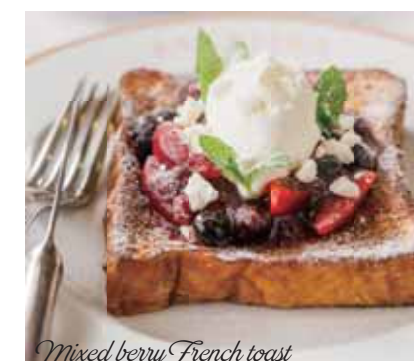
Mixed berry French toast

Chestnut crème caramel • chestnut cream, Mascarpone, chestnuts in syrup, salted butter caramel sauce