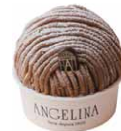
デミサイズ DEMI (Half-size)